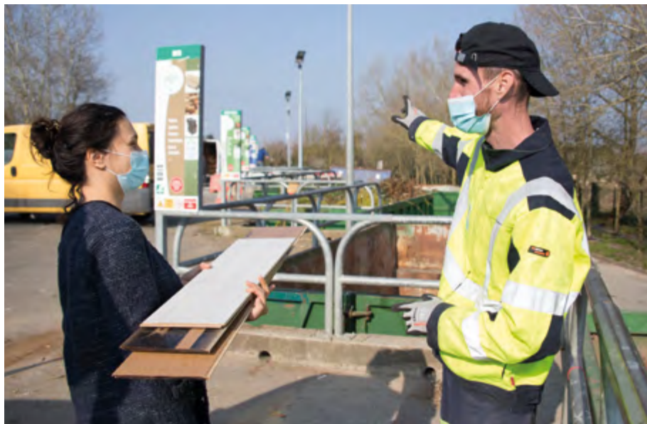
L'accueil en déchetterie : une façon professionnelle de reprendre confiance en soi.

Notre but, c'est de mettre la personne au centre de ses choix pour qu'elle construise son propre projet.