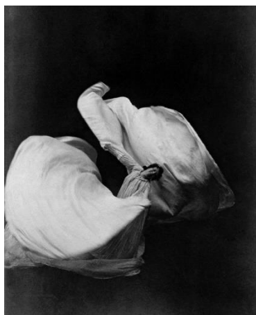
Loïe Fuller (1862 - 1928)

• Les danseurs souhaitent explorer d'autres formes de mouvements et de pas de danse que ceux fixés pour la danse classique. Ils éprouvent le besoin de se libérer des codes, des costumes et des pointes pour les danseuses.