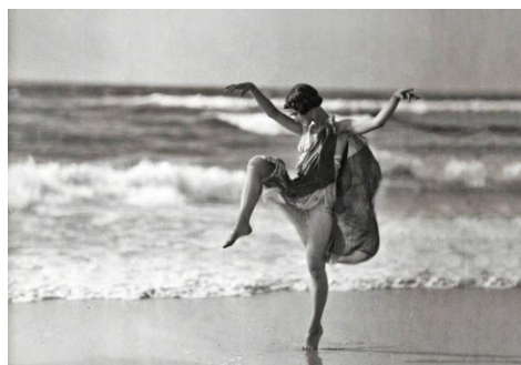
Isadora Duncan (1877 - 1927)

• Cette nouvelle forme de danse sera appelée La danse libre où des danseuses comme Loïe Fuller et Isadora Duncan danseront pieds nus.