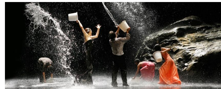
« Vollmond » (2006)