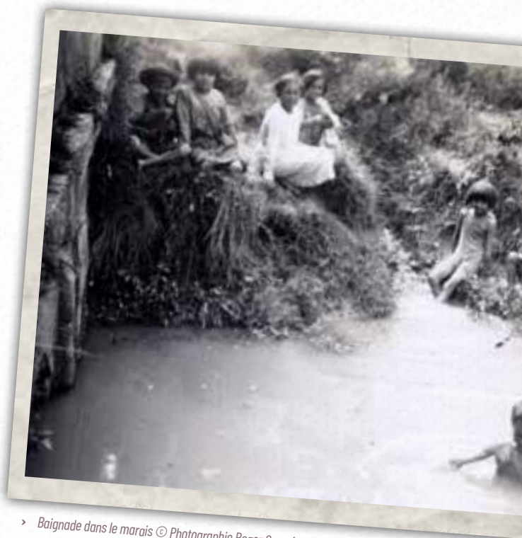
> Baignade dans le marais © Photographie Roger Sarazin - 47B17, Archives Rochefort Océan.