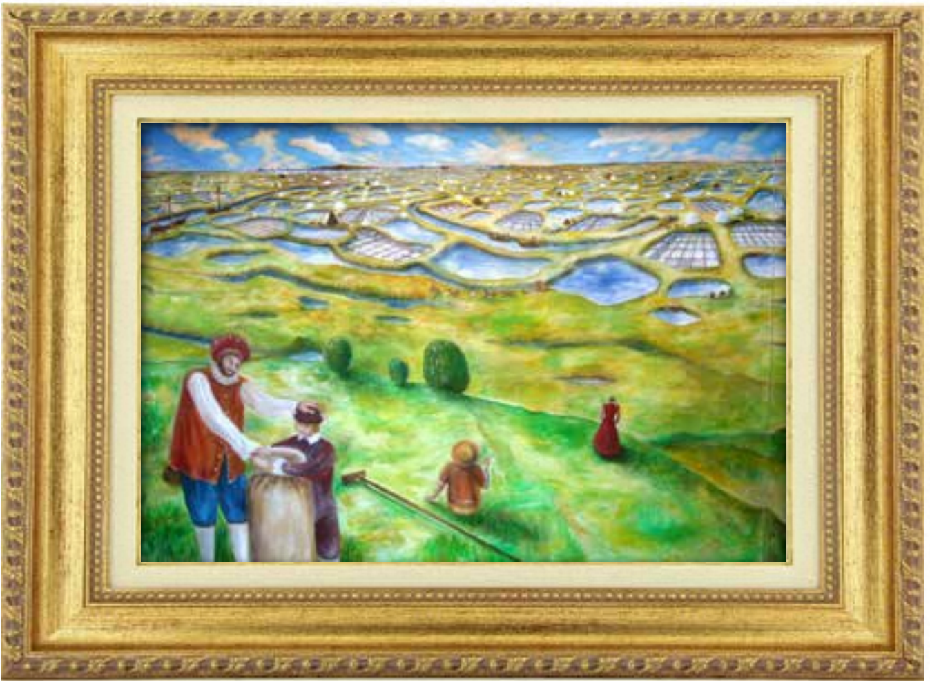
› Représentation de l'ancien golfe de Saintonge au XVII ème siècle