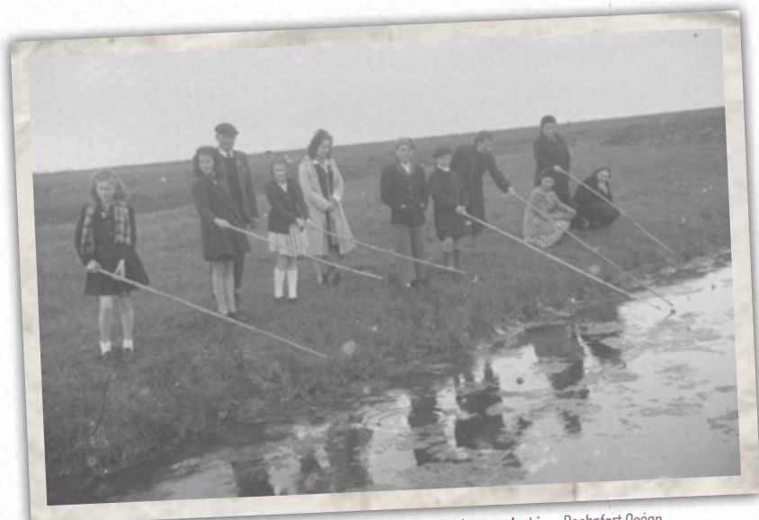
> Pêche aux anguilles à la vermée © Fonds numérique Alain Rocheteau, Archives Rochefort Océan.

Au cours des XIX ème et XX ème siècles, mes aïeux ont acquis à Mérignac (commune de Bourcefranc-Le Chapus), 75 ha de marais que nous avons vendus en 1989 au Département de la Charente-Maritime pour qu'ils deviennent les terrains d'application du Lycée de la mer. Nous avons également des marais à Gravat, à Conat et à La Pauline sur la commune de Saint-Just-Luzac. C'était un autre espace et des sensations différentes de celles de Mérignac, des ambiances particulières sur les rives de la Seudre et de ses ruissons.