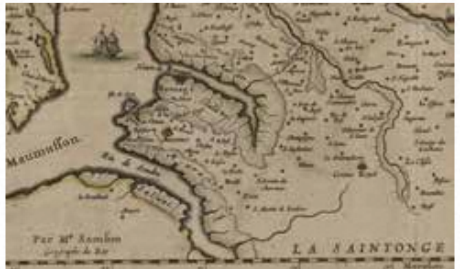
> Le havre de Brouage en 1650 par Nicolas Samson, cartographe du Roi.

Au XVII ème siècle, on assiste à la mainmise d'un capitalisme hors-sol sur le marais de Brouage. Ce dernier générant alors d'importantes richesses, ce sont en effet des acteurs beaucoup plus éloignés qui vont s'y intéresser. C'est l'une des raisons pour lesquelles les grands ministres du roi comme Richelieu ou Mazarin vont investir dans le marais de Brouage pour essayer de continuer à faire fonctionner cette machine qui tourne à plein régime. Avec le règne de Louis XIV, la Ferme Générale qui est au plus près du gouvernement à Versailles, supervise l'administration de la gabelle.